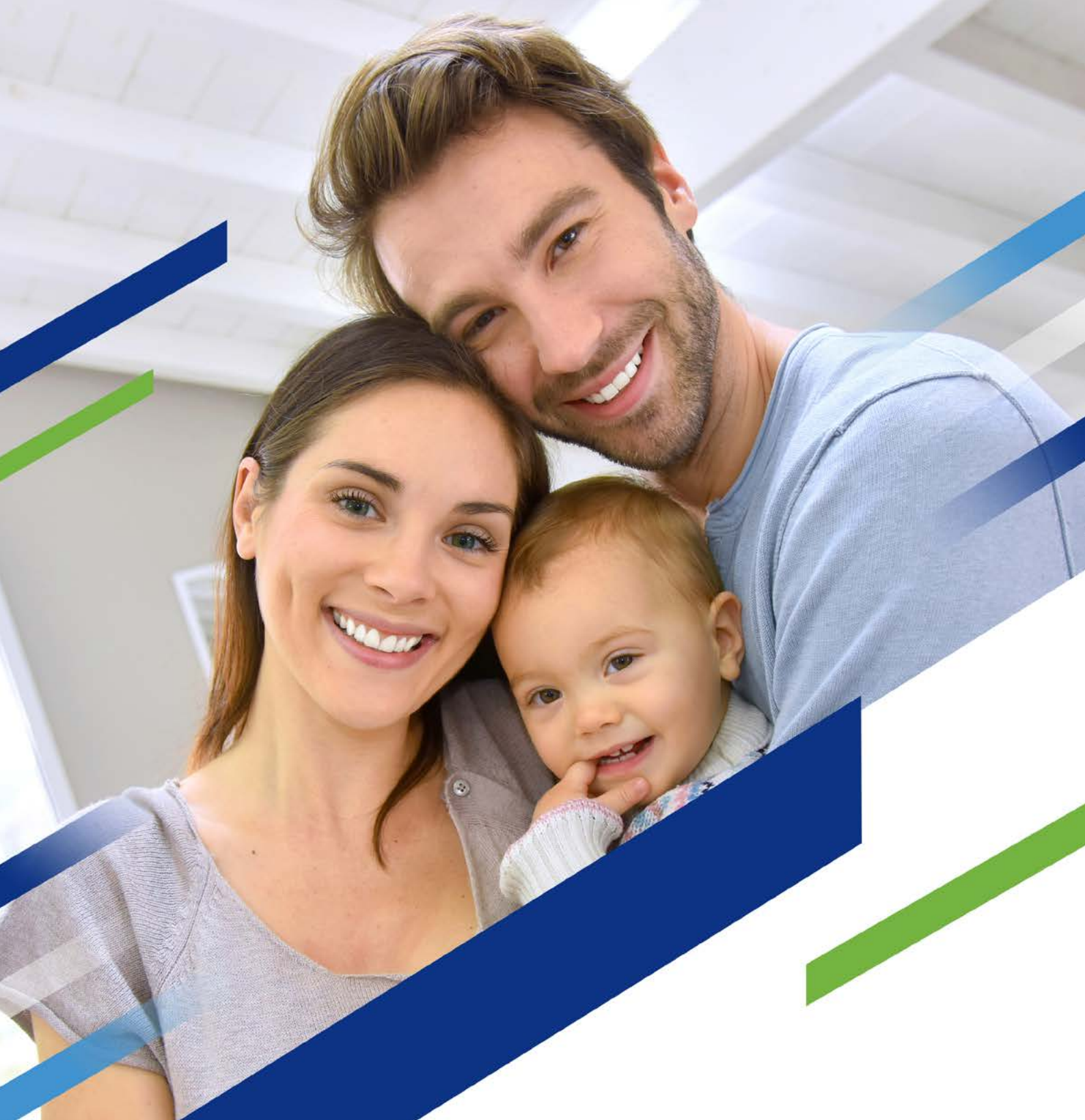
TABELA DE VENDAS PRODUTO ESSENCIAL INTERIOR - MINAS GERAIS